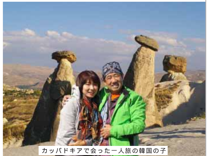
カップドキアで会った一人旅の韓国の子